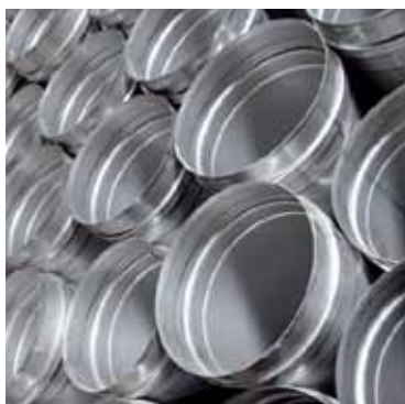
Mange dimensjoner lagerføres.