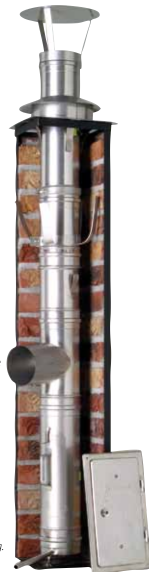
EW til rehabilitering.