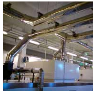
Prosessavtrekk i næringsmiddelindustrien.