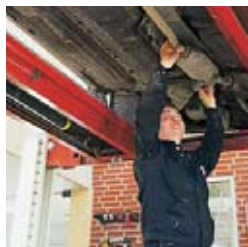
Med varmluftaggregater fra Dantherm sikres et godt indeklima.